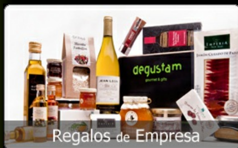
Regalos de Empresa